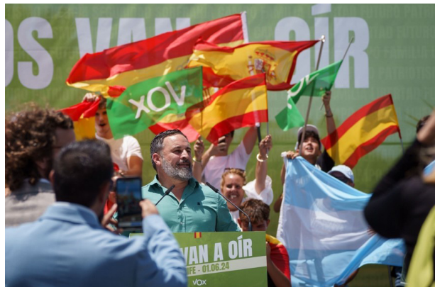
Митинг партии Vox в г. Санта-Крус-де-Тенерифе

Не меньше внимания уделяется партиям правого толка — в том числе стремительно «взлетевшему» в последние годы Vox'у и тогда же, напротив, драматически «рухнувшей» партии Ciudadanos.