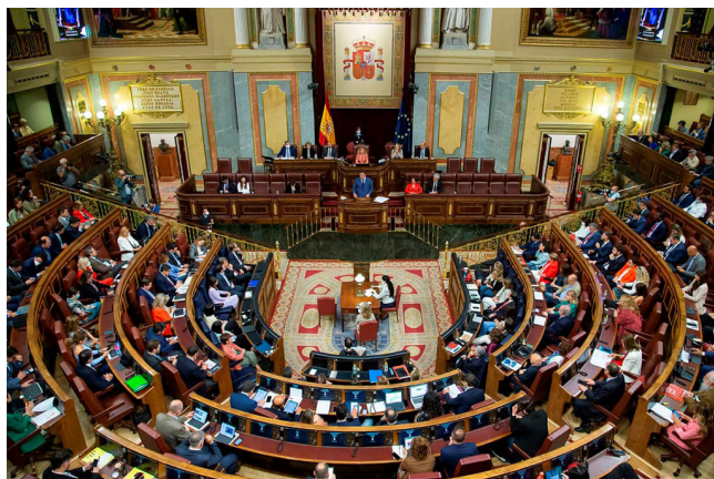
Председатель правительства Испании Педро Санчес выступает на пленарном заседании Конгресса депутатов

В завершающем монографию всестороннем аналитическом обзоре внешней политики Испании «на рубеже второго-третьего десятилетий XXI в.» (раздел «Новые ракурсы международных отношений») внимание читателя, несомненно, привлекут несколько актуальных сюжетов, в числе которых — общее ослабление международных позиций Мадрида, «поворот на Восток по-испански», отказ Испании от позиции «над схваткой»