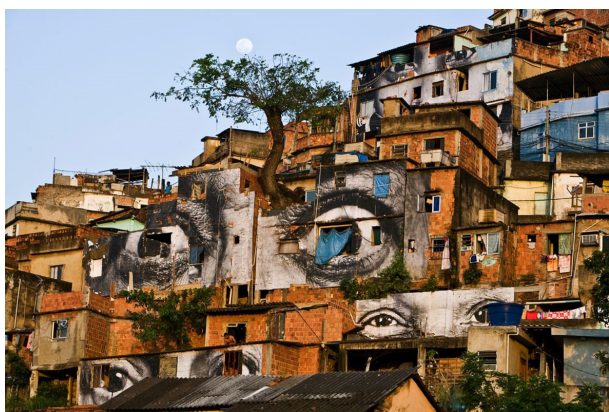
Вид современной фавелы

Фавеле как «фабрике маргиналов» [Birman, 2008] был противопоставлен термин комундади , также не появившийся из ниоткуда. Немаловажную роль в формировании этого концепта сыграла доктрина Теологии освобождения 25 , проповедовавшая идеал организованной христианской общины бедняков, основанной на солидарности и взаимопомощи. Однако в первую