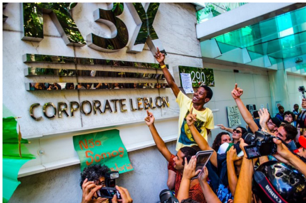
Ролезинью в торговом центре «Леблон» в Рио-де-Жанейро

Эффект, произведённый на социум этими мерами инклюзии, оказался громким. Об этом свидетельствует, в частности, феномен «ролезинью» (от rolé — на сленге бразильских подростков «прогуливаться, фланировать»), в январе 2013 года скандализовавший общество и ставший темой для обсуждения в соцсетях, расколов публику на два лагеря. Речь шла о достаточно распространившемся среди подростков с периферии времяпрепровождении — приходить большой группой в ближайший торговый центр и проводить там время без определенной цели, но не совершая при этом хулиганских действий. Иногда они даже покупали какой-либо предмет — кепку или кроссовки известной