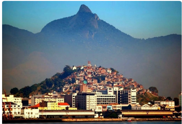
Первая фавела Бразилии на холме Провидения

Наиболее глубокий пласт коллективной памяти заложен в истории самого слова « фавела », которое принесли в столицу с северо-востока страны отставные солдаты, вернувшиеся после подавления восстания в Канудосе, вдохновившего бразильца Эуклидеса да Кунья (Euclides da Cunha, 1866–1909) на его документальное повествование «Сертаны» («Os Sertões», 1902) и перуанца Марио Варгаса Льюсу (Mario Vargas Llosa, 1936–2025) на роман «Война конца света» («La guerra del fin del mundo», 1981). В местном названии дикой мандиоки — растения, способного цвести и давать семена в условиях засушливой каатинги 9 , — как будто заключалось предвидение той борьбы за выживание, которую в будущем придётся вести населению бразильских фавел. Оказавшиеся бездомными, солдаты обосновались на холме Провидения ( Morro de Providência ), который беспорядочно, подобно тому как фавела хаотично покрывала землю Канудоса, облепили живописные в своём убожестве домики. Холм Провидения стал называться холмом Фавелы. Вскоре там поселились также жители близлежащего куртису Кабеса-ду-Порку ( Cabeça-de-Porco ), ликвидированного в 1893 году.