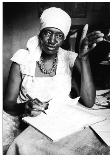
Каролина Мария ди Жезус подписывает экземпляр книги «Хламная комната: дневник из фавелы»

Автор — уже немолодая, многодетная негритянка — живёт в одной из фавел Сан-Паулу в поистине мультирасовой среде: рядом с ней испанка роется в отходах рефрижератора, португалка стоит в очереди за бесплатными костями, а чёрные и белые соседки с наслаждением рвут друг другу космы 10 . Присутствуют даже цыгане, однако они «хуже, чем негры» 11 . Авторская манера К.М. ди Жезус — едкая и ироничная — не выдерживает критики с точки зрения современного расового и тем более гендерного нарратива: «В фавелах мужчины ведут себя более воспитанно и терпимо, чем женщины. Все беспорядки от них. Эти интриганки действуют на нервы похуже, чем Карлос Ласерда» 12 .