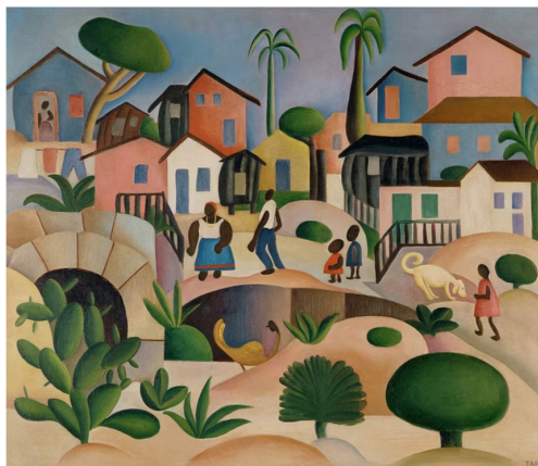
Тарсила ду Амарал. Холм фавелы