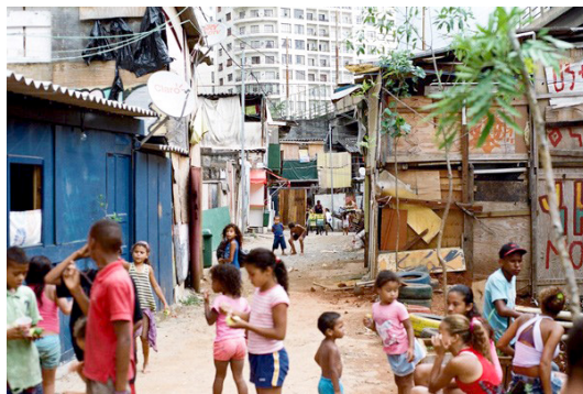
Жители трущобы Favela do Moinho в Сан-Пауло

Существование прочных социальных связей и неизбежное влияние взросления в трущобах на мировоззрение их жителей отражаются, например, в том, что жители бразильских трущоб называют их comunidade ,