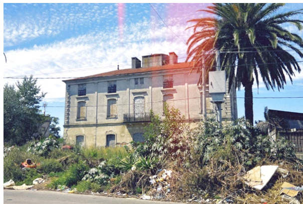
Заброшенная гостиница Гиот в районе Лесика, Монтевидео

Наконец, еще один немаловажный критерий выбора участка для несанкционированного заселения — это способность оказаться на виду и побудить власти и власть имущих к решению возник-