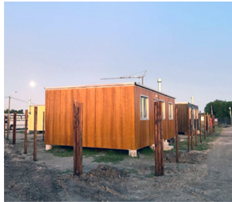
Дома, возводимые в Санта-Эухения при поддержке НКО Cireneos и участии будущих жителей

В то же самое время есть и скептики, иронизирующие на тему «чудес» в судьбе трущобного поселения Санта-Эухения. Результаты журналистского расследования левоориентированного издания «Caras&Caretas» свидетельствуют о том, что трущобы возникли на участке частной фирмы, принадлежащей лицам, связанным с Национальной партией — ведущей правоцентристской силой в стране. В материале содержится намек, что появление представителей этой партии на торжественном мероприятии по случаю ввода в эксплуатацию первой серии домиков из контейнеров связано с близостью этих мест к полузакрытым районам для обеспеченных слоев уругвайского общества, а также тем, что собственник земли в 2022 г. выиграл суд, подтвердив свое право на занимаемые самостроем земли, предназначенные для жилой застройки 39 .