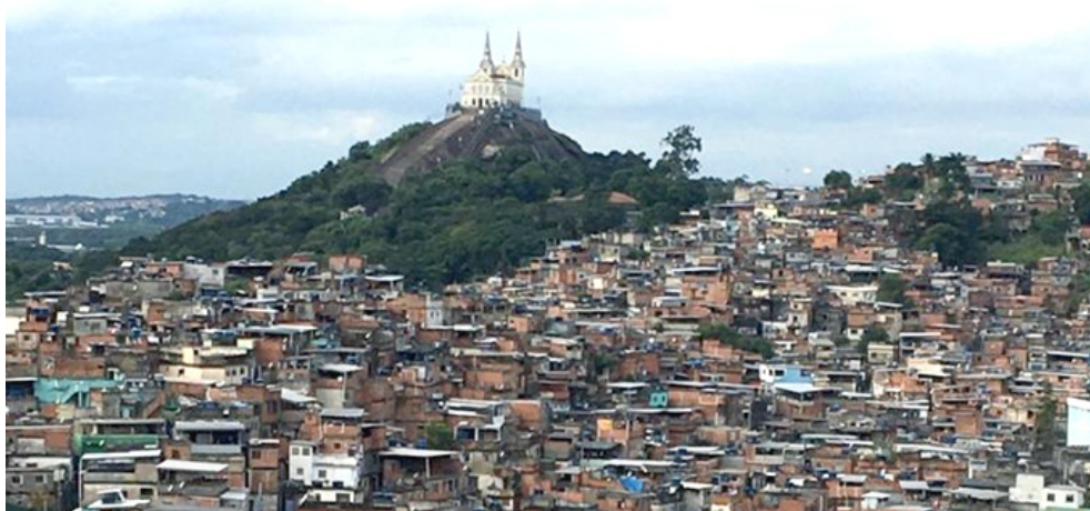
Фавелы Вила Крузейро в Рио-де-Жанейро

В рамках небольшого исторического экскурса заметим, что нередко в латиноамериканском контексте стихийная неконтролируемая застройка становилась основой будущих городов. В Уругвае, например, в 1831 г. была создана Топографическая комиссия, предназначенная для обеспечения нормированного градостроительства, поскольку вокруг торговых пунктов и постоянных дворов по всей стране возникали хаотичные самострой [Franco, Raffo, 2014: 69].