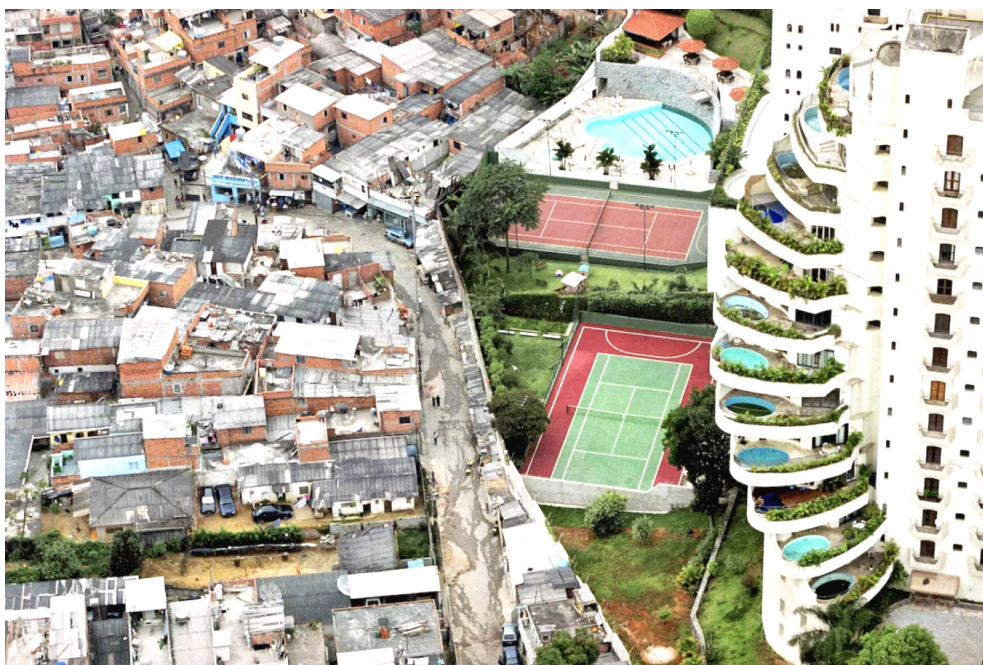
Фотография Тука Вейра, отражающая социальное неравенство. Слева — фавела Парайсополис, справа — богатый район Морумби. Сан-Паулу, 2004