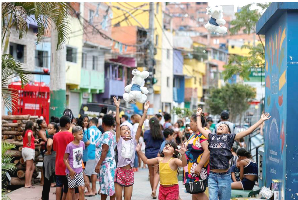
В рамках благотворительной акции дети из фавелы Парайсополис получили подарки на Рождество. 2023