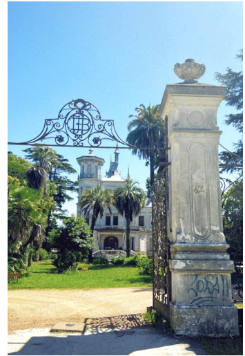
Замок президента Идиарте Борды

Монтевидео переживает опережающий рост предложения жилья, что, однако, не ведет к решению жилищной проблемы. Ситуация, при которой строятся многоэтажные здания с преимущественно малогабаритными квартирами, влечет за собой удорожание стоимости квадратного метра в среднем и делает невозможной покупку недвижимости для большого