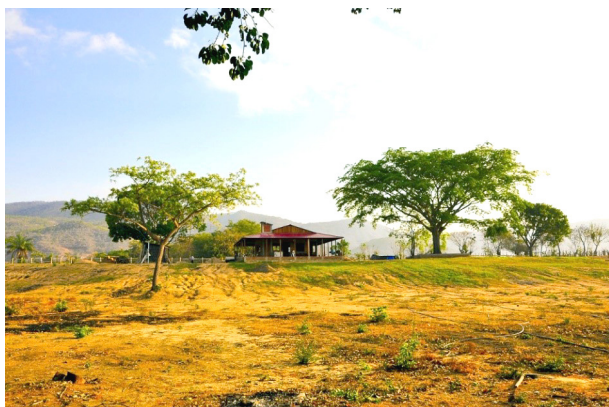
Эхидо в муниципалитете Куаутемок, Мексика

— Да, она была такая. Но сейчас она в той или иной мере испытала последствия mestizaje . Чистого материала на практике нет, он возможен на почве химии, но не в реалиях общественного процесса. Индейцы, будь то в Эквадоре или в Боливии, стали другими. Они строят свою политическую практику по законам партийной организации. Европейский опыт они усваивают в прямой или косвенной форме. Они давно не строят жизнь по родо-племенному принципу, пусть община и является долгоживущим общественным институтом, что и к нам относится. Но сейчас уже настало время, когда община не способна адаптироваться к современной жизни. Пример — эхидо 3 в Мексике. Там долго берегли эхидо, в том числе на законодательном уровне, а потом (лет 30 назад) поняли, что эхидо имеет и свои минусы в современной практике. В данном случае я не имею в виду апелляцию к «свободе личности». В объяснении сложившейся ситуации я ближе стою к критериям экономической целесообразности и технологического прогресса. Но и они, разумеется, вписываются в соответствующий цивилизационный контекст.