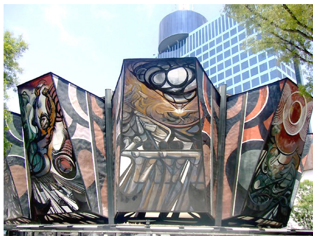
Давид Альфаро Сикейрос. Мурал «Марш человечества» в Полифоруме им. Сикейроса, Мехико

Идеи Хосе Васконселоса перекликаются с другим символическим образом — маршем человечества в Полифоруме великого муралиста Давида Альфаро Сикейроса (David Alfaro Siqueiros, 1896–1974). Пафос того и другого взаимодополняются по глубинному смыслу.