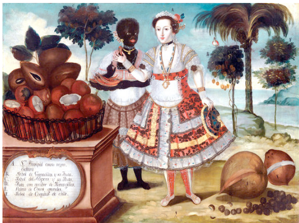
Висенте Альбан. Благородная дама со своей темнокожей рабыней. 1783

В то же время земли Нового Света мощно втягиваются в мировой рынок, пусть и опосредованно. Основными товарами мирового рынка становятся колониальные товары. Лавки колониальных товаров появляются в Петербурге, в Нижнем Новгороде, Ярославле. Россия вообще-то к этому не имела прямого отношения, но мировая торговля не оставляла «белых пятен».