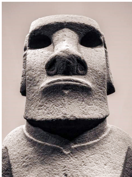
Базальтовая статуя Хоа Хакананайа с острова Пасхи