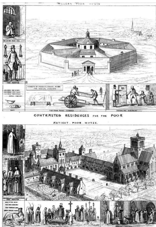
A. Pugin. Contrasted Residences for the Poor 14 . 1836

Согласно А. Лефевру (Henri Lefebvre, 1901–1991), улица представляет собой пространство, в котором общество проявляет себя и где становятся особенно очевидны исторические, политические и культурные изменения [Lefebvre, 2001: 252]. Лефевр также отмечает революционные события как