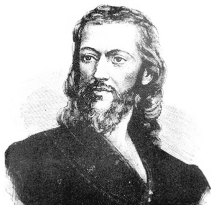
Tiradentes, patrono cívico da nação brasileira

Tanto assim que Alexandre Pushkin (1799–1837) escreveu uma poesia inspirada na Lira IX da segunda parte do livro «Marília de Dirceu», dedicado por Gonzaga à amada.