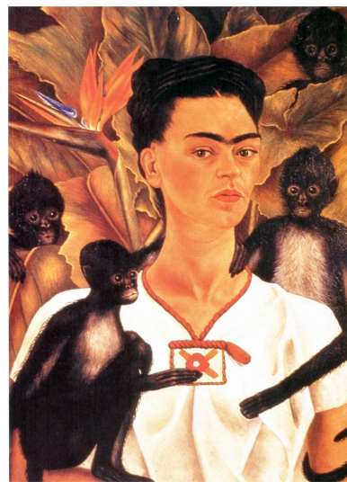
Традиционная индейская туника уипиль на картине Ф. Кало «Автопортрет с обезьянками». 1943