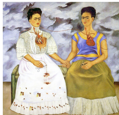
Две Фриды. Ф. Кало. 1939

Ключевым мотивом мексиканского самосознания становится образ метиса (mestizo). Эта двойственная природа всех мексиканцев (и самой художницы, чей отец был родом из Германии, а мать — испано-индейского происхождения) изображена на картине Ф. Кало «Две Фриды», где одна Фрида в европейском платье, а другая — в традиционном мексиканском.