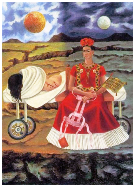
Дерево надежды, стой прямо!