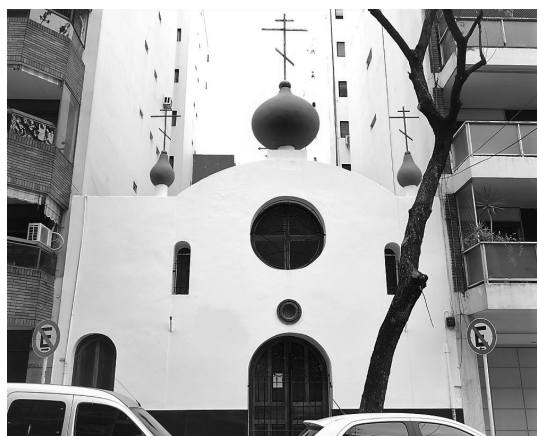
Благовещенский кафедральный собор в Буэнос-Айресе