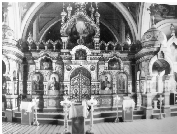
Свято-Троицкий собор в Буэнос-Айресе

Ключевую роль в создании первого храма в Латинской Америке сыграл молодой и активный настоятель Константин Гаврилович Изразцов, который лично занимался сбором средств на храм, объезжая с проповедями и воззваниями российские города. В 1889 г. на постройку храма пожертвовали Николай II и другие члены императорской фамилии. В результате, в 1901 г. была освящена Свято-Троицкая церковь в Буэнос-Айресе [Архимандрит Августин, 2001: 34]. Невероятной красоты храм стал центром русской культуры в Аргентине, и сам К.Г. Изразцов занялся культурной деятельностью.